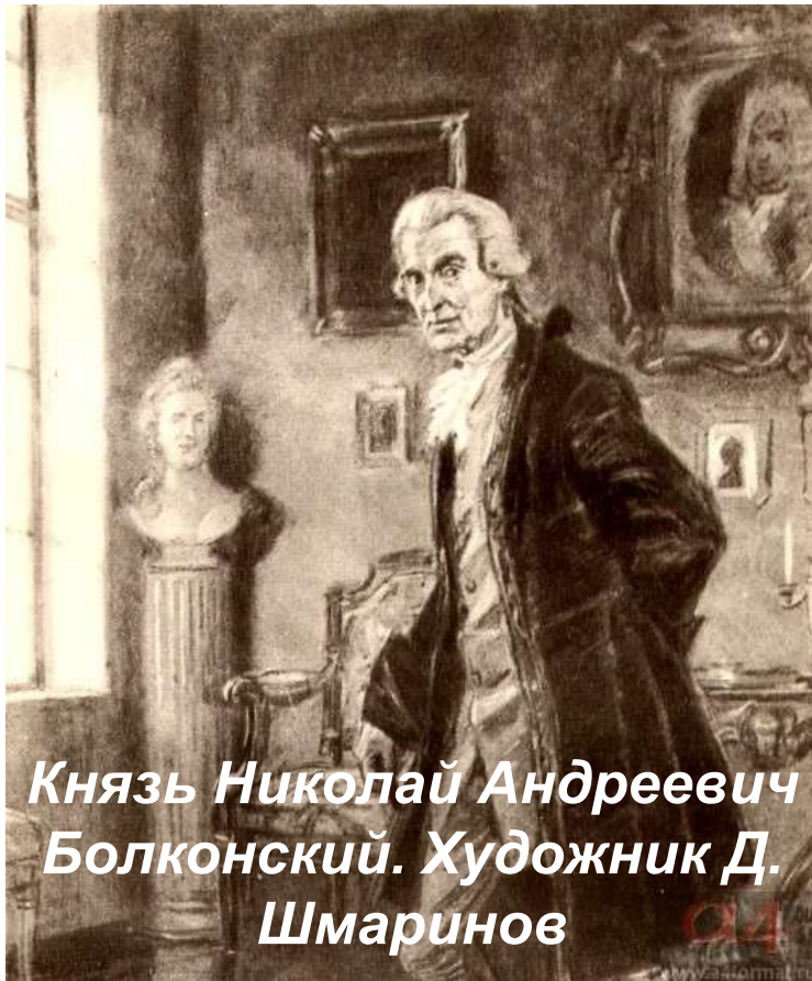
Князь Николай Андреевич Болконский. Художник Д. Шмаринов