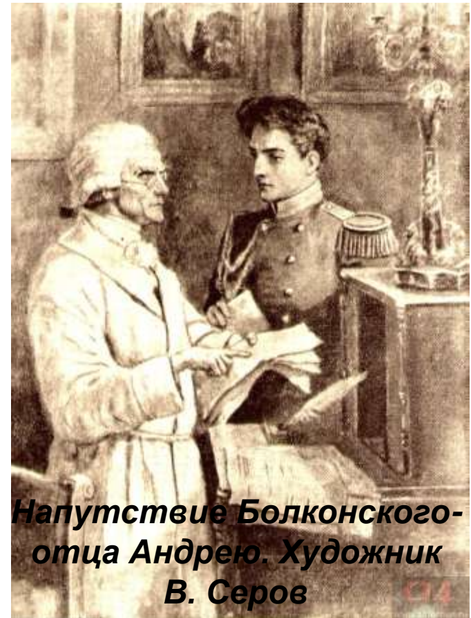
Напутствие Болконского- отца Андрею. Художник В. Серов